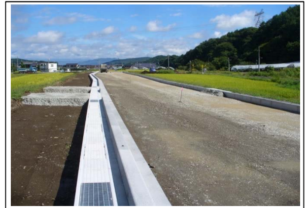
側溝、路盤工施工状況 →