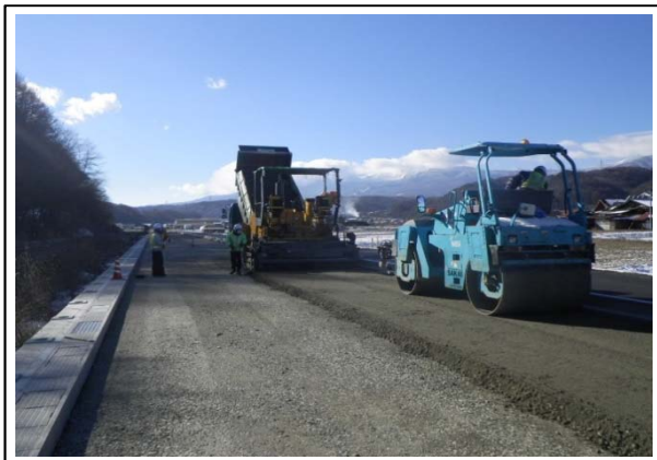
←路盤工施工状況 (平成26年10月)