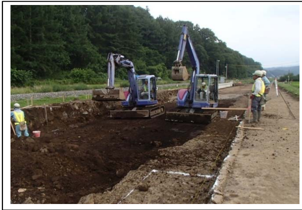
←土砂掘削状況 (平成25年8月)