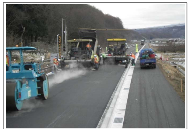
舗装工施工状況 → (平成26年12月)