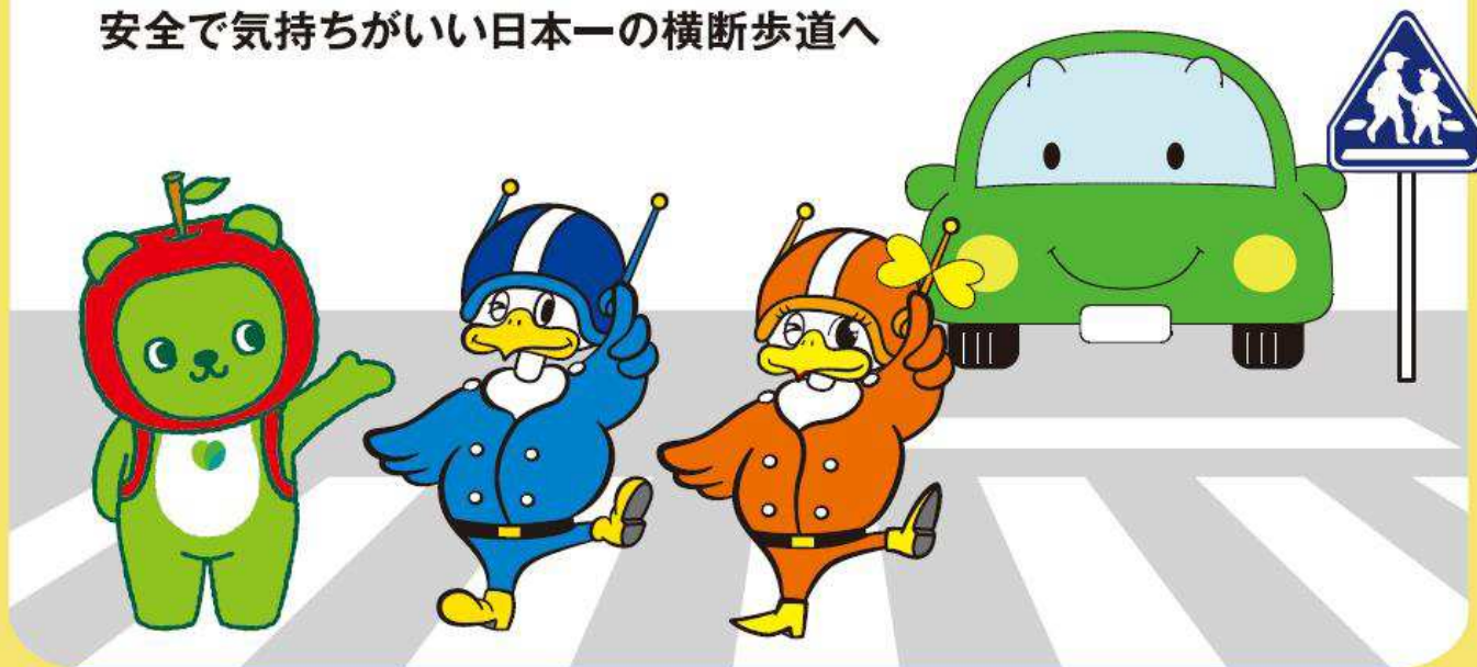
長野県PRキャラクター「アルクマ」 ©長野県アルクマ

ドライバーの「歩行者優先！」のルール遵守と 歩行者の「手を上げて横断歩道を渡る！」マナーアップ行動で 安全で気持ちがいい日本一の横断歩道へ