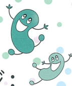
まがちゃん たまちゃん