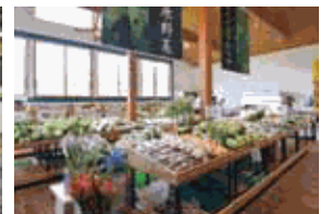
南牧村農畜産物直売所